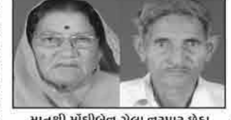
मातुश्री मोधीबेन गेला नरपार छेडा गागोडर