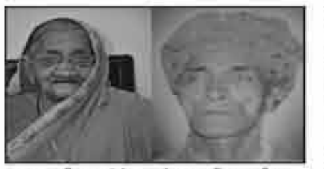
मातुश्री मुरधबेन गांगलु हीरलु रीटा लाकडीया