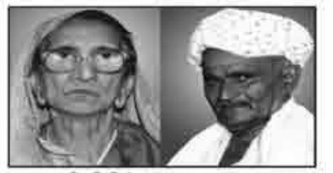
मातुश्री मीठीबेन अरजण लयु गाला लाकडीया