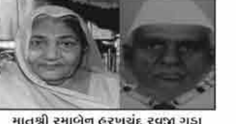
मातुश्री रमानेन हरणयंद रवजु गडा भयाई