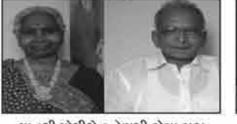
मातुश्री मोधीबेन नेणशी डोसा गडा लाकडीया