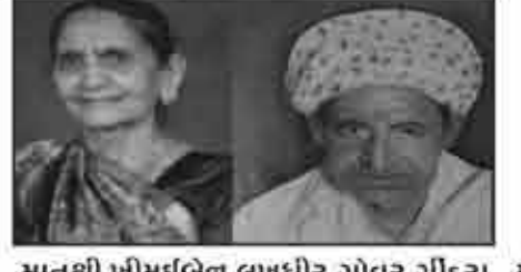
मातुश्री भीमधबेन लजधीर गोवर गींदरा हलरा