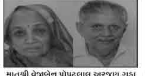
मातुश्री वेजुबेन पोपटलाल अरजण गडा आधोई