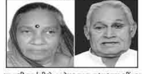
मातुश्री पार्वतीबेन पोपटलाल लधामाइ गींदरा आधोई