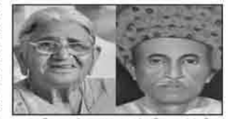
मातुश्री रामुबेन लयुभाई लीमामाई रीटा लाकडीया