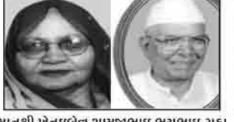
मातुश्री जेतधबेन शामजुभाइ लयुभाइ गडा आधोई