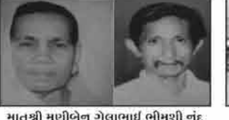
मातुश्री मणीबेन गेलामाई लीमशी नंदु लाकडीया