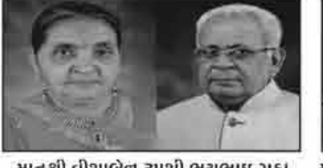
मातुश्री वीशाबेन इपशी लयुभाइ गडा आधोई